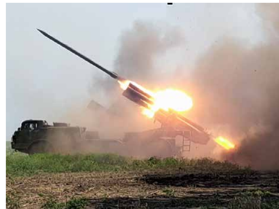
DOTARE Imaginile cu riposta lansatoarelor de rachete ucrainene Uragan au fost realizate pe frontul din sudul regiunii Harkov