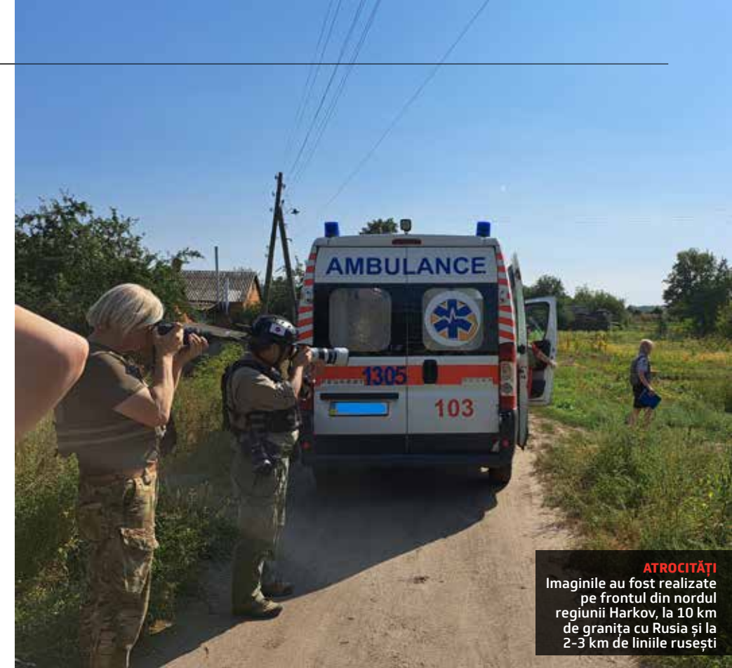
ATROCITĂȚI Imaginile au fost realizate pe frontul din nordul regiunii Harkov, la 10 km de granița cu Rusia și la 2-3 km de liniile rusești