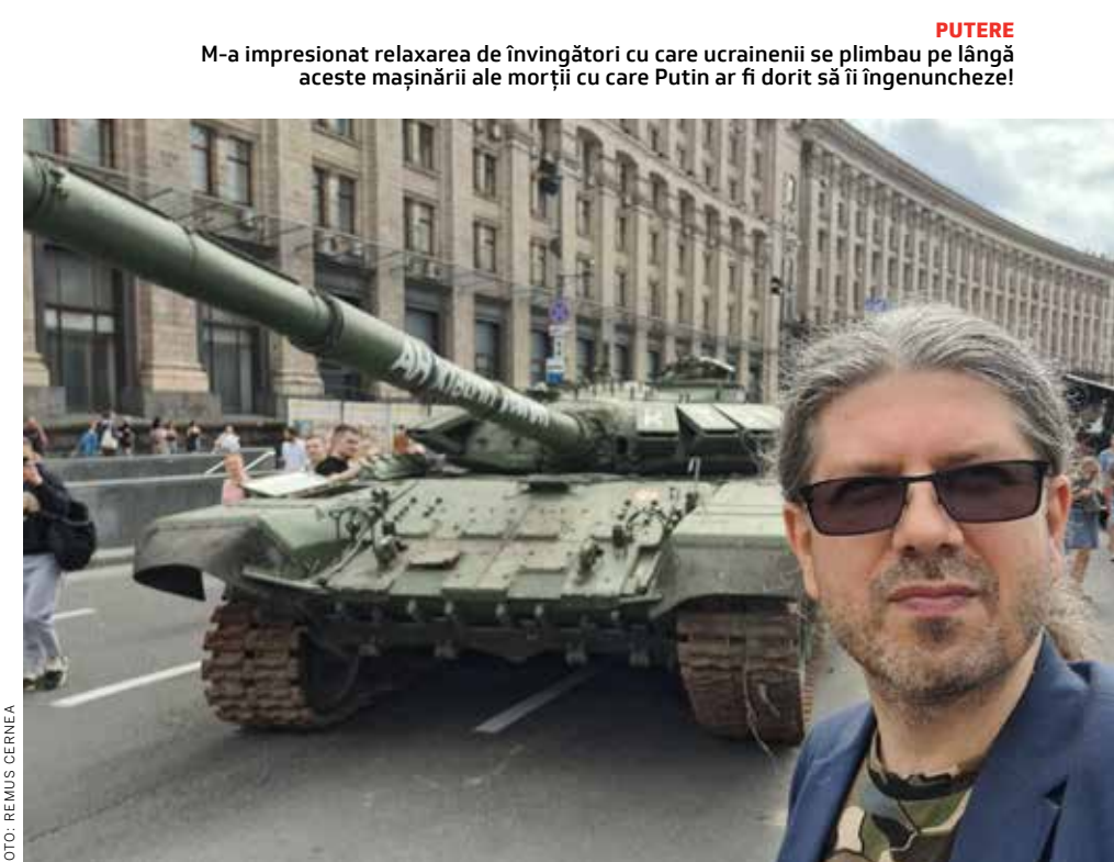
PUTERE M-a impresionat relaxarea de învingători cu care ucrainenii se plimbau pe lângă aceste mașinării ale morții cu care Putin ar fi dorit să îi îngenuncheze!