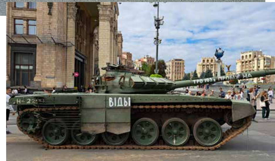
„EXPOZIȚIE” Imaginile au fost realizate în preajma Zilei Independenței Ucrainei (24 august) când centrul Kievului a găzduit „parada” tancurilor rusești distruse sau capturate de ucrainenii după invadarea țării în 24 februarie 2022